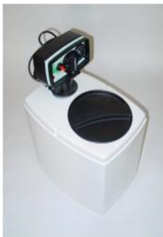
Zařízení jsou schválena pro pitnou vodu

Odstranění železa a manganu – automatické filtry