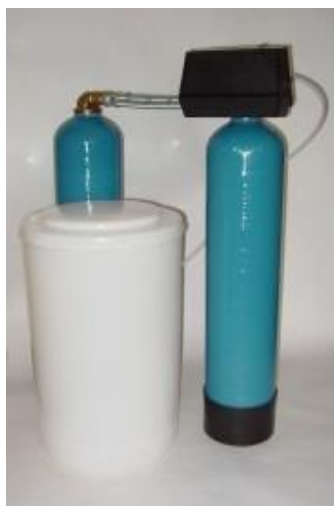
Zařízení jsou schválena pro pitnou vodu