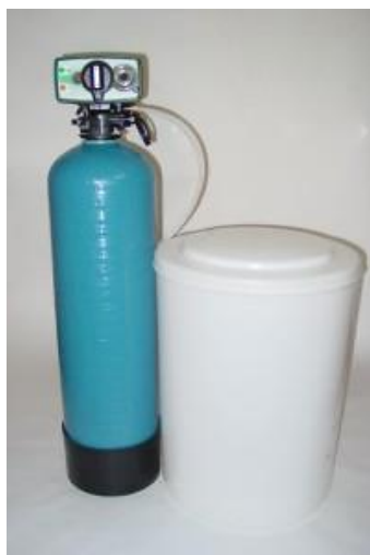
Zařízení jsou schválena pro pitnou vodu