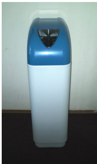
Zařízení jsou schválena pro pitnou vodu