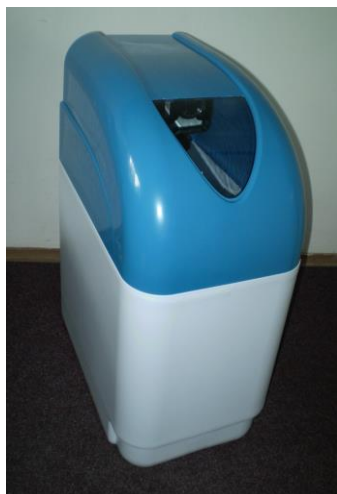
Zařízení jsou schválena pro pitnou vodu

VAK 10 P MINI ZF 1" VAK 10 P MINI ZF 1" E