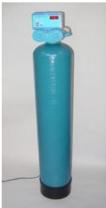
Zařízení jsou schválena pro pitnou vodu