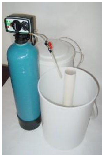
Zařízení jsou schválena pro pitnou vodu