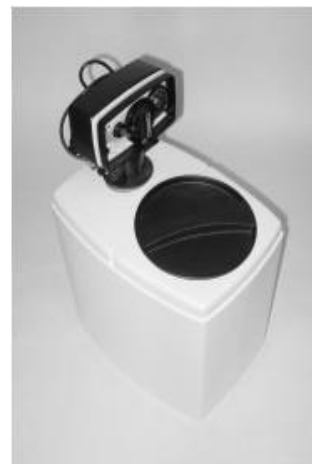
Zařízení jsou schválena pro pitnou vodu

Filtr se do rozvodu vody zapojuje by-passem, nastavení se provádí na základě rozboru vody. Tuto činnost doporučujeme svěřit firmě Wermont s.r.o. – Upravitvodu.cz, stejně jako montáž i údržbu (kompletní servis).