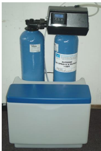
Zařízení jsou schválena pro pitnou vodu